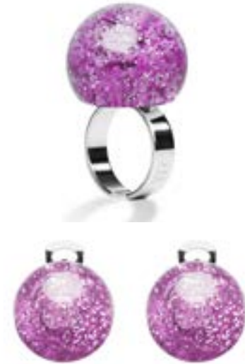
Orecchini clip e perno Anelli