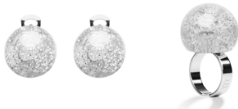
● 003 Mercurio