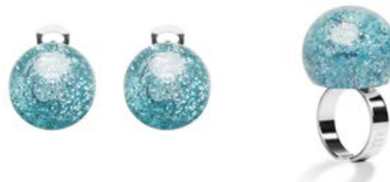
● 004 Venere