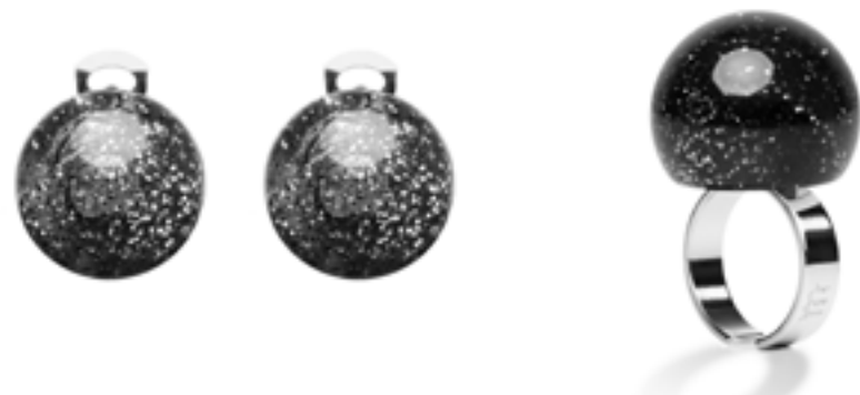
● 001 Luna