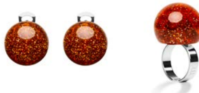
● 002 Sole