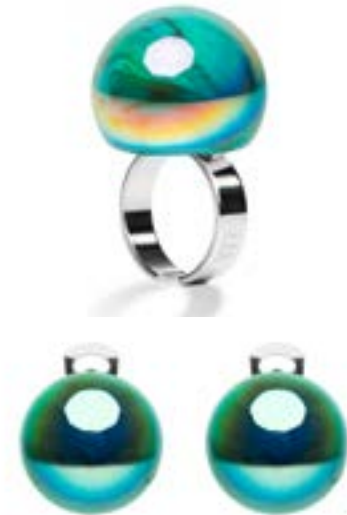
Orecchini clip e perno Anelli